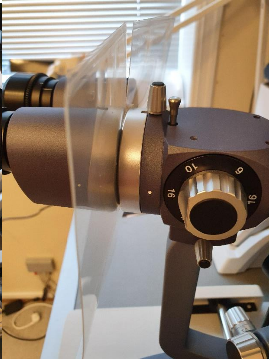
Montert bak okularene som i filmen

Bilder nedenfor gjelder stor skjerm som er sendt til sykehus og klinikker Klipp langs den stiplede linjen og tre bak okularene som vist på filmen på www.innz.no Trekk litt fra hverandre og tre bak okularene, NB Hullet er ikke midt på skjermen den kan roteres hvis man ønsker mer skjerming enten oppe eller nede