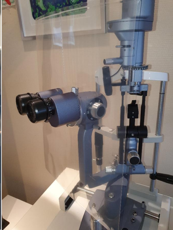
Oversiktsbilde av spaltelampe med stor skjerm